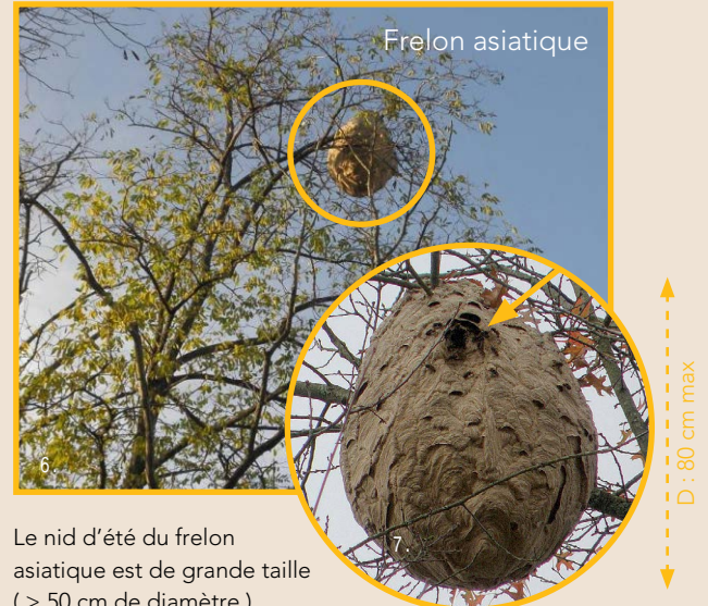
Le nid d'été du frelon asiatique est de grande taille (> 50 cm de diamètre). Souvent construit haut dans les arbres. Petite ouverture latérale .

Les nids. Guêpes et frelons construisent des nids en utilisant des fibres de bois qui leur donnent un aspect de carton léger.